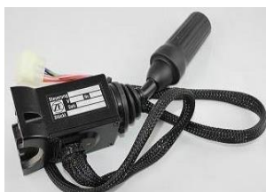
DW-2, DW-3 e DW-4