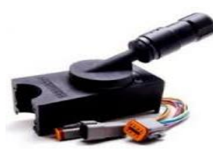
EM BREVE Seletora CATERPILLAR

Caso sua máquina possua um outro modelo de seletora, basta entrar em contato conosco. Temos um DEPARTAMENTO e LABORATÓRIO TÉCNICO ESPECIALIZADO para realizar a codificação de sua Seletora e CENTRAL ECU para o nosso sistema de conversor de seletora de volante para joystick.